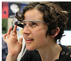
5 lingue sulla punta delle dita in 2 settimane! Un metodo sperimentale...