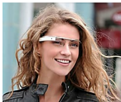
L'inglese in soli 7 giorni e il tedesco anche in 5! Efficacia garantita