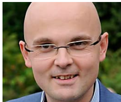
Il complesso Favorita ha un proprietario