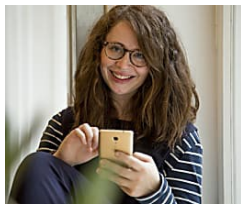
Volete imparare una lingua velocemente? Ecco la app creata da 10...