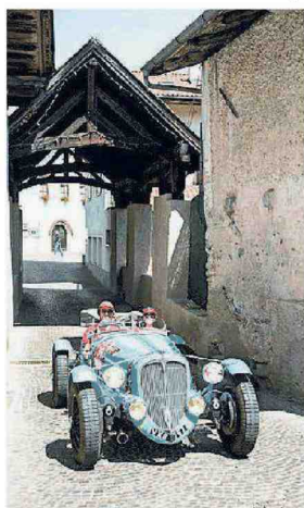
Tourneur su Delahaye 135 S