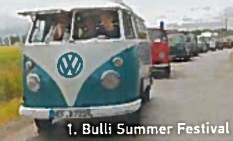
1. Bulli Summer Festival