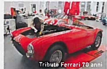
Tributo Ferrari 70 anni