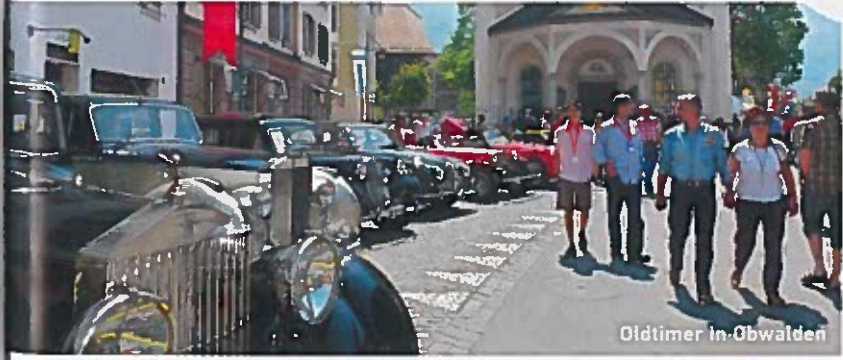
Oldtimer in Obwalden