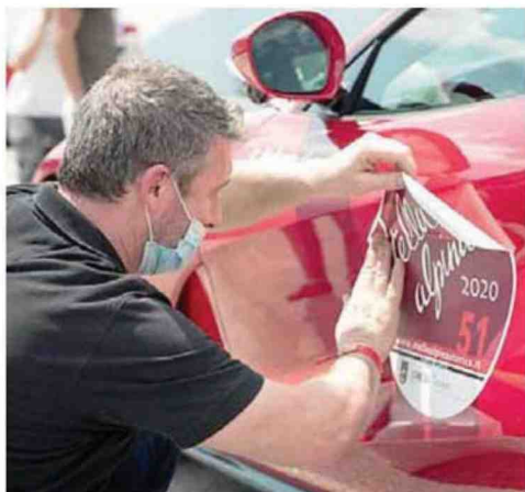
• L'allestimento della vettura