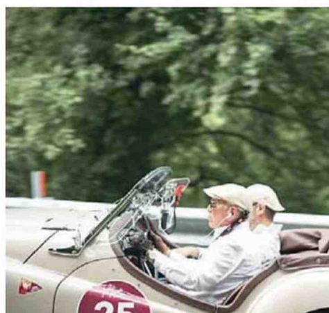
• Equipaggiamento vintage