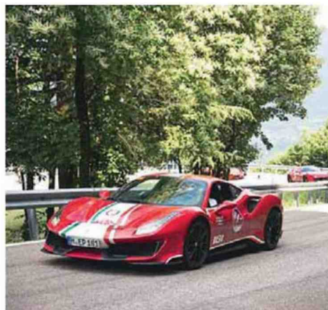
• Macchine "aggressive"