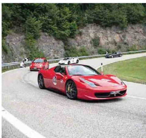
• Una Ferrari in tutto il suo splendore