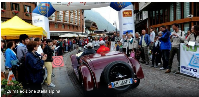
28 ma edizione stella alpina

TI TROVI SU: Home » Autoweb » Stella Alpina 2018: si lavora alla 33° rievocazione storica